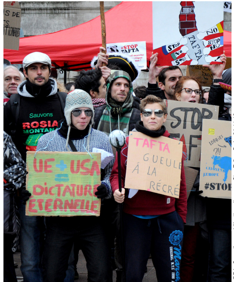
mobilisation citoyenne Stop Tafta - Paris, 24.11.13

La libéralisation des services : TAFTA vise la libéralisation et la dérégulation de tous les services qui ne seraient pas explicitement « protégés » dans une liste soumise par l'UE. Les services financiers sont concernés, au risque de provoquer une nouvelle crise financière internationale ! De plus, l'harmonisation des normes européennes et américaines pourraient encourager au